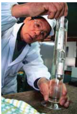
酒の味に妥協を許さない真剣なまなざし