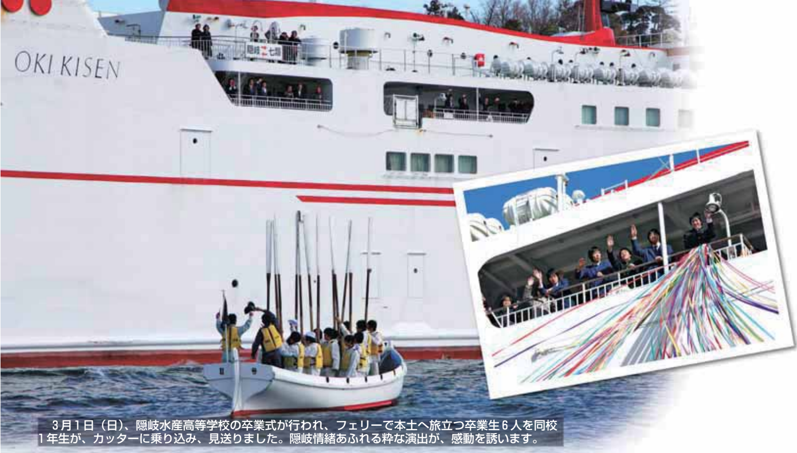
3月1日(日)、隠岐水産高等学校の卒業式が行われ、フェリーで本土へ旅立つ卒業生6人を同校1年生が、カッターに乗り込み、見送りました。隠岐情緒あふれる粋な演出が、感動を誘います。