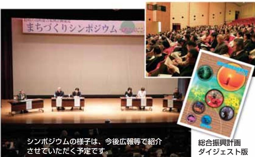
シンポジウムの様子は、今後広報等で紹介させていただきます。