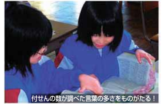
付せんの数調べた言葉の多さをものがたる!