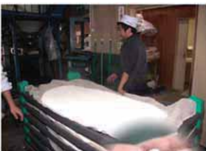
↑できあがった麹 白く粉を帯び、甘い味がします→